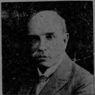
Licenciado don Ricardo Jiménez O. Ex-Presidente de la República